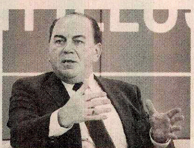
Technological progress will affect inflation, says Axel Weber, chairman of UBS Group

"Technological progress will put a lid on how inflation can re-emerge," Axel Weber, chairman of UBS Group, said in Davos. The worry is that the so-